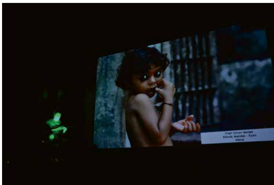
Prezentacja nagrodzonych fotografii na kinowym ekranie z granym na żywo gitarowym podkładem.

Wygląda na to, że Wojnicz mocno zaznaczył swoją obecność na fotograficznej mapie.