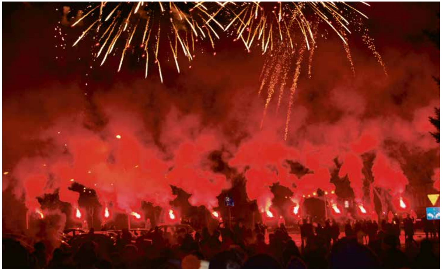
Hucznie witano rok 2016 w Wojniczu. Na Rynku muzyka, szampan i sztuczne ognie.