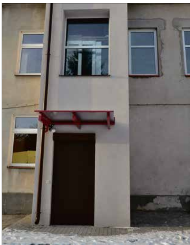
Dzięki nowej windzie szkoła w Wielkiej Wsi jest w pełni przystosowana do potrzeb osób niepełnosprawnych.

Osoby niepełnosprawne każdego dnia napotykają na różnego rodzaju bariery, choćby architektoniczne. Ich funkcjonowanie w świecie, w ramach dostępnej infrastruktury jest bardzo często ograniczone z powodu braku dostosowania budynków, chodników, środków komunikacji do ich potrzeb. Dlatego cieszy fakt, że jedna z barier w Wielkiej Wsi została właśnie zniesiona.