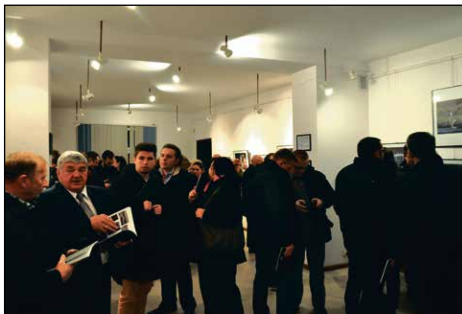
Wszystkie nagrodzone prace można było zobaczyć w Galerii Findrówka przy Izbie Regionalnej.

prawdopodobnie pierwszym przypadkiem w historii, gdy już w pierwszej swojej edycji